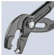
Практичные поворотные захваты служат для хорошего доступа к хомуту в любом положении