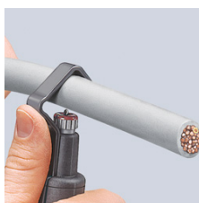
Установка инструмента для разреза по окружности